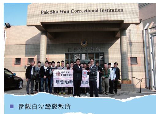
■ 參觀白沙灣懲教所