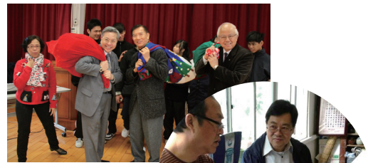
■ 馬爾他騎士團成員與學生慶祝聖誕

來自聖雲先會、聖本篤堂、聖歐爾發堂和馬爾他騎士團的成員、以及堂區教友、社區義工和家長等，均熱心為明愛特殊學校提供義工服務。他們在學生的學習過程中注入新元素，且鼓舞其學習志趣；更重要的是明愛特殊學校與各社區伙伴連結，逐步建立關愛和富人情味的社區。