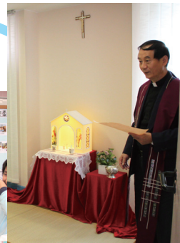
■ 閻神父與學校師生及家長共聚感恩和歡愉的時光