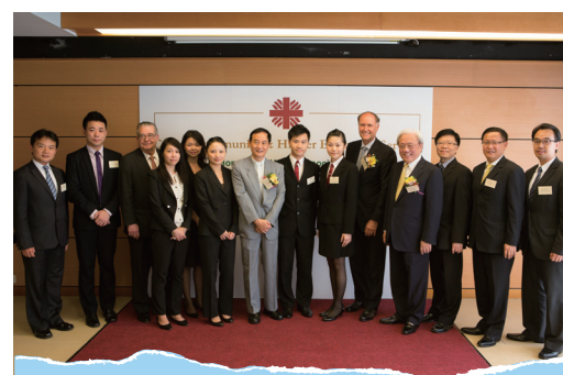
■ 香港酒店業協會各酒店代表與主禮嘉賓留影

本服務共有31名應用學習課程學員獲頒由「羅氏慈善基金」與教育局合辦的2011/2012年度「高中應用學習獎學金」。