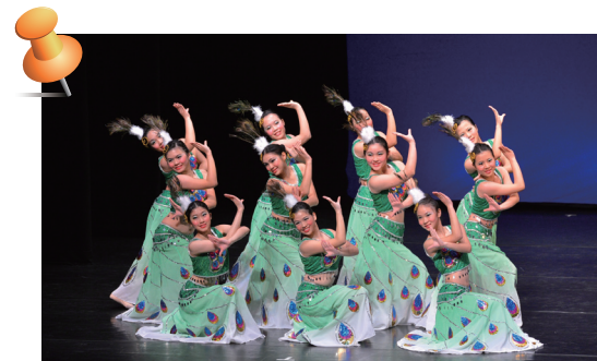
■ 得獎的中國舞(群舞)

明愛培立學校學生參加由教育局及香港學界舞蹈協會合辦的「第49屆學校舞蹈節」，獲頒中國舞(群舞)及中國舞(三人舞)兩項甲級獎。此外，一名學生在7,000多名參選學生中脫穎而出，獲頒2011/2012青苗十大進步獎。獲獎學生感到非常高興，藉此也鼓勵其他同學要努力爭取成果。