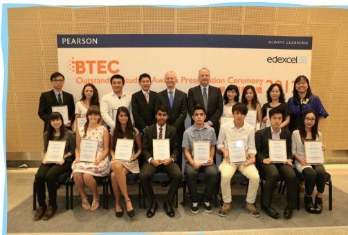
■ 得獎學員出席BTEC傑出學生獎頒獎典禮2012

五位來自白英奇學校的學生獲頒BTEC傑出學生獎2012，頒獎典禮於2012年5月23日假英國駐香港總領事館舉行。