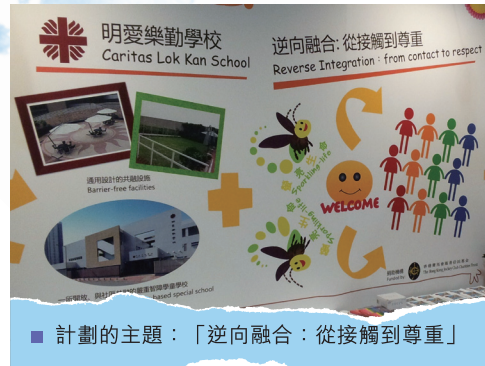
■ 計劃的主題：「逆向融合：從接觸到尊重」

明愛樂勤學校在2012年11月參與教育局的「學與教」博覽，展示其「螢亮生命」計劃。此計劃藉著主流學校學生與明愛樂勤學校師生一起活動和交流，建立彼此對生命和生活的正面及健康價值觀。