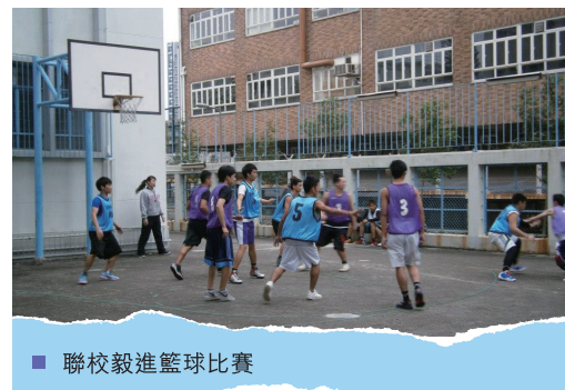
■ 聯校毅進籃球比賽

本服務獲得教育局撥款資助，於2012年9月至2013年3月期間，為毅進文憑全日制學員舉辦了多項不同種類的學員活動。