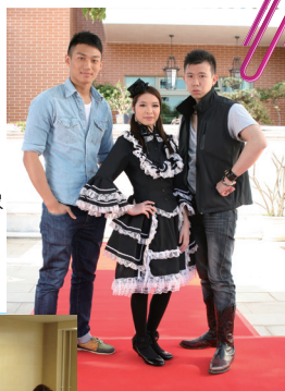
■ 模特兒及個人形象導引課程