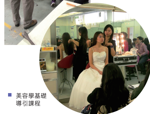
■ 美容學基礎導引課程