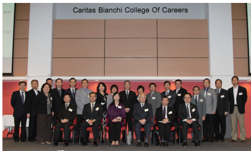
■ 主講嘉賓、校董及校長合照

當天下午安排了共16個小組為不同的題目作重點研討，題目包括：如何提高教師的教學效能及學生的學習動機、學生學習差異的處理、天主教價值觀、個人理財要訣及教師身心減壓方法等。