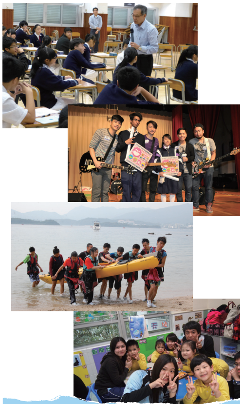
■ 明愛中學為學生提供多元化的課程及課外活動

香港明愛轄下的郊野學園位於長洲，為本港的教師及學生提供自然科學課程，同時亦提供課程予普羅大眾，以期提高公眾對環境保護的意識及可持續性發展的關注。