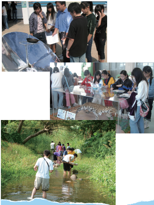
■ 學生參與不同類型的實習課堂及野外考察