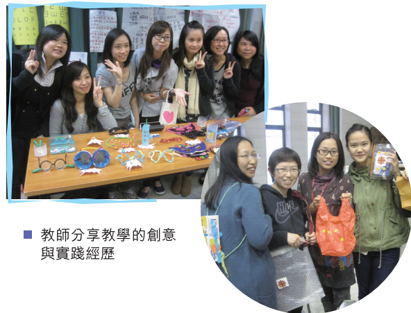
■ 教師分享教學的創意與實踐經歷

為回應第37屆啟思營主題「美好家庭，美好社會」的討論，本服務於2013年3月4日及2013年3月5日舉行2013年度校長及行政人員啟思會，主題為「建構更美善的家庭與社會－共融關係之傳承與發展」。經過討論，規劃了五年服務發展計劃(2013-2018)，並以三項目標為工作重點：(1)在服務對象及員工層面均推動和諧的家庭關係與氣氛；(2)促進家長與家庭教育以配合兒童的不同需要；及(3)承傳以「兒童為中心」及「家庭為本」的服務持續發展方向。