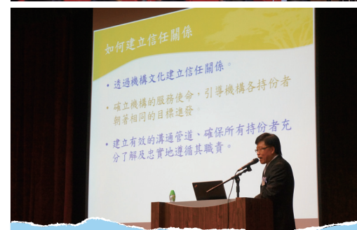
■ 社區及高等教育服務周年職員發展日2012