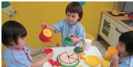
■ 「讓我們一起遊戲與學習」— 由幼童階段培育孩子的社群與情緒發展

學前教育服務（“本服務”）旨在提供一個愉快的學習環境，培養七歲以下兒童在德、智、體、群、美、靈六育的均衡發展。