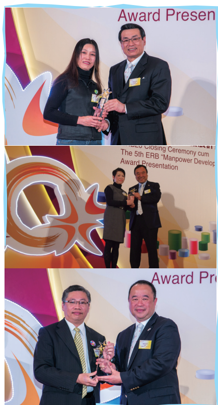
■ 本服務在第五屆僱員再培訓局ERB「人才發展計劃」頒獎禮中取得令人鼓舞的成績

柏立基爵士信託基金頒獎典禮已於2013年1月14日假香港專上學院(西九龍校園)舉行，本服務共有七位毅進計劃結業學員獲頒該獎項。