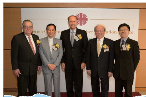
■ 香港酒店業協會獎學金頒授典禮主禮嘉賓

香港酒店業協會獎學金頒授典禮已於2012年7月17日舉行。本服務共有15位全日制酒店課程學員獲香港酒店業協會頒贈該項獎學金。