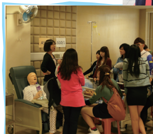
■ 健康護理培訓工作坊引發學員學習興趣

本服務獲得教育局撥款資助，於2012年9月至2013年3月期間，為毅進文憑全日制學員舉辦了多項不同種類的學員活動。