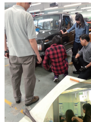
■ 汽車科技導引課程

2012/2014年度新高中應用學習課程已於2012年9月開學；有來自133間中學共1,055名學員參加2013/2015年度新高中應用學習導引課程。