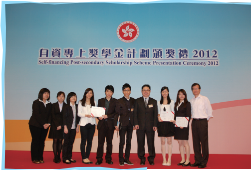
■ 得獎學員出席自資專上獎學金計劃頒獎禮2012

二十位來自明愛專上學院及白英奇學校的學員獲教育局局長頒發自資專上獎學金計劃的「卓越表現獎學金」及「最佳進步獎」。