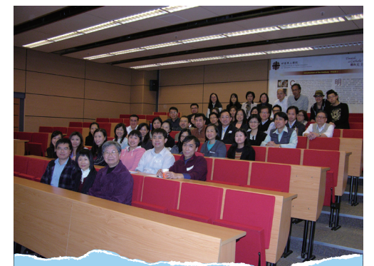
■ 為明愛專上學院及白英奇學校員工舉辦的2012/2013年度啟思日

明愛專上學院及白英奇學校積極推動員工發展目標，兩院校於2012/2013年度共籌辦10項員工發展活動。