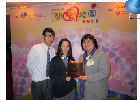
■ 2012年度關愛校園獎勵計劃

由教育局、香港基督教服務處及香港輔導教師協會聯合舉辦之「2012年度關愛校園獎勵計劃」中，本服務轄下八所資助中學均獲授「關愛校園獎」。