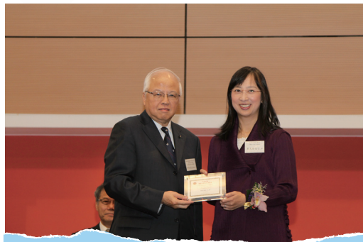
■ 頒贈紀念品予主禮嘉賓

主講嘉賓於活動中就不同議題分享他們寶貴的意見及經驗，議題包括：「香港專上教育之發展及與中學教育之銜接」、「社區及高等教育服務與職業訓練及教育服務之間的部門協作」及「怎樣提升教學效能」。