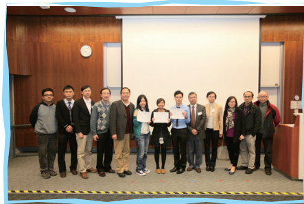
■ 柏立基爵士信託基金頒獎典禮

柏立基爵士信託基金頒獎典禮已於2013年1月14日假香港專上學院(西九龍校園)舉行，本服務共有七位毅進計劃結業學員獲頒該獎項。