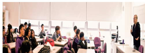
■ 導引課程助學員探索升學前景

明愛專上學院、明愛白英奇專業學校（“白英奇學校”）、明愛美容專業中心及明愛賽馬會社區教育中心 – 荃灣於2013年3月11日聯合為本服務毅進文憑全日制學員舉辦了多項導引課程，共有超過575名學員參加。學員能夠透過導引課程探索升學前景並掌握最新的升學資訊。