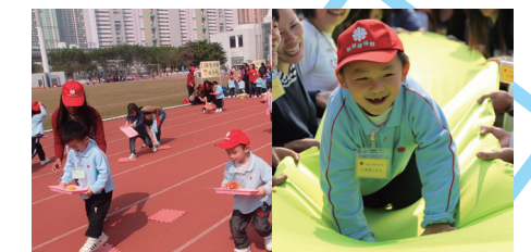
■ 兒童與家長在運動日投入地參與