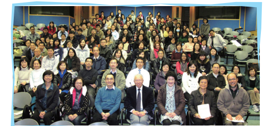
■ 講者與參加者合照

特殊教育服務轄下六所特殊學校將在2012年至2015年分三階段成立法團校董會，香港教區天主教教育事務處為各校的持分者提供一系列講座及工作坊，加強彼此對天主教教育核心價值的知悉和認同。