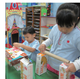
■ 一份立體創作— 兒童運用不同物料製造「橋」