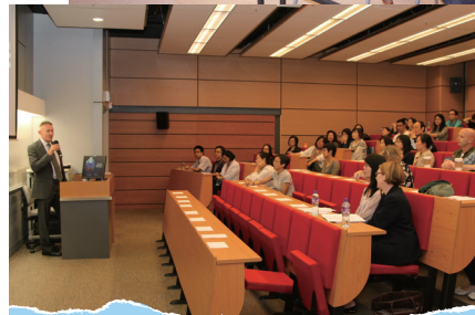
■ 教師參與各分組研討