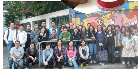
■ 社區義工參與美化校園