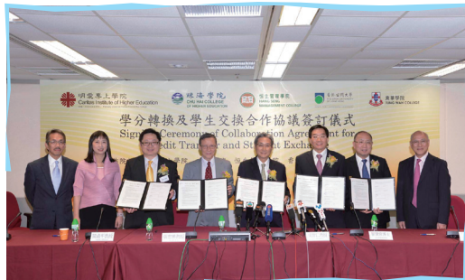
■ 「學分轉換及學生交換合作協議」簽訂儀式

明愛專上學院聯同香港公開大學、珠海學院、恒生管理學院及東華學院於2012年10月24日簽訂「學分轉換及學生交換合作協議」，共同承認學生所修讀的學分，並接受相互學分轉換及學生交換計劃。