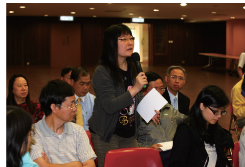
■ 出席者向主講律師提問