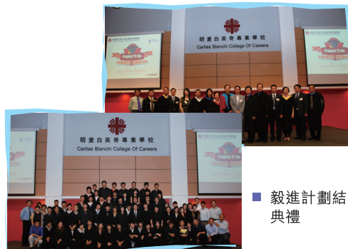
■ 毅進計劃結業典禮