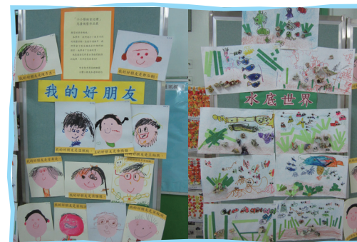
■ 從視覺藝術走進孩子的世界