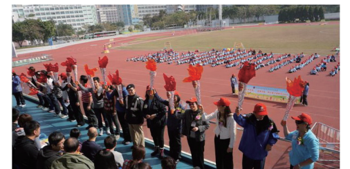
■ 聯校親子運動日啟動禮

2013年1月17日，本服務舉行「以愛傳希望—『健康家庭』聯校親子運動日」活動，藉以慶祝明愛60周年及倡導和諧家庭關係的重要性。是次活動啟動禮由教育局代表、明愛副總裁及明愛社會服務部長主禮，超過1,400名兒童與家長參加。本服務更獲得教育局家庭與學校合作事宜委員會撥款資助，印製了一本名為「以愛傳希望 健兒、樂兒、愛兒小『搜』冊」的冊子。